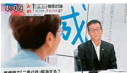
読売テレビ「かんさい情報ネットten.」(7日)