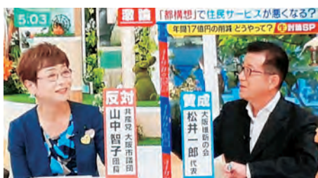
毎日放送 (MBS) 「ミント!」(12日より)

公明・土岐市議団幹事長は批判されると、突然「共産党は予算に反対した」とテーマとはまったく関係のない話にすりかえていいわけ。